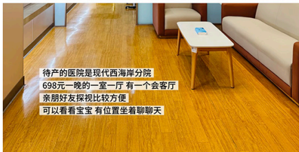
待产的医院是现代秀英分院 698元一晚的一室一厅有一个会客厅 亲朋好友探视比较方便 可以看看宝宝位置坐着聊聊天