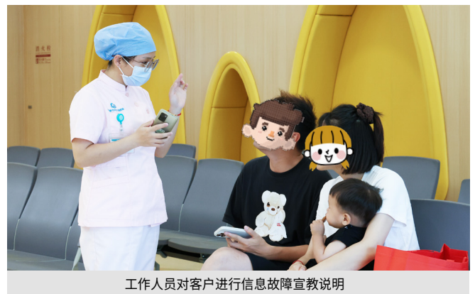
工作人员对客户进行信息故障宣教说明

出院，全流程手工实操，堪比一部医疗版“极限挑战”。各观察员手持记录本，蹲点“找茬”，认真记录每一个细节——表单填对了吗？流程熟练吗？时间达标了吗？